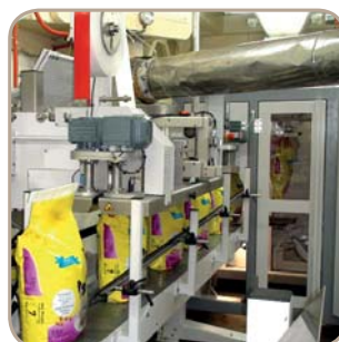
Машина для запаивания пакетов Statec Binder SBSM-OS в действии