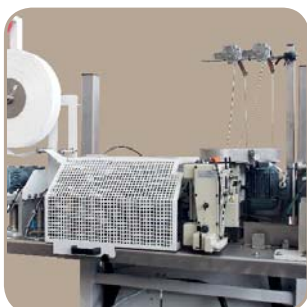
Машина для зашивания пакетов оснащена сшивающими головками другого производителя

Система SBSM-OS для запаивание пакетов тканым ПП поверх ленты