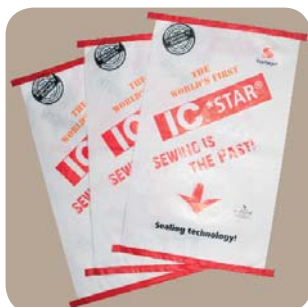
Запаянный тканый ПП пакет