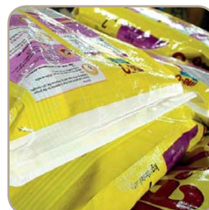
Зашитый ПП пакет запаиванный тканым ПП поверх ленты

Возможно дополнительное зашивание пакета и его герметизация. Для зашивания пакет сначала перемещается при помощи встроенной сшивающей головки. После зашивания пакет обрезается сверху и затем запаивается с использованием тканой ПП ленты. Концы герметизирующей ленты обрезаются справа и слева в непосредственной близости от кромки пакета. В целях обеспечения надежного и безопасного закрытия пакеты часто зашиваются и дополнительно запаиваются.