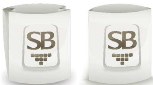
Готовые пакеты с открытым верхом

Автоматическое высокопроизводительное упаковочное оборудование