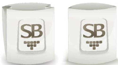
Sacos de boca aberta pré-fabricados

Máquina de ensaque totalmente automática de alta velocidade